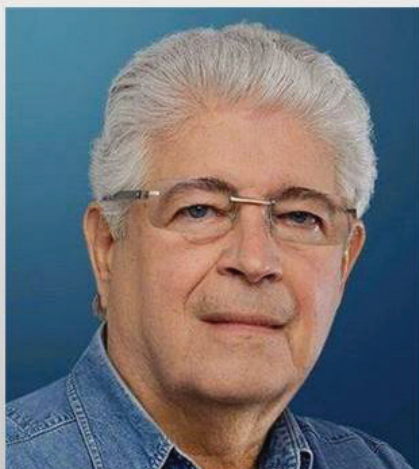
Roberto Requião 26 de agosto