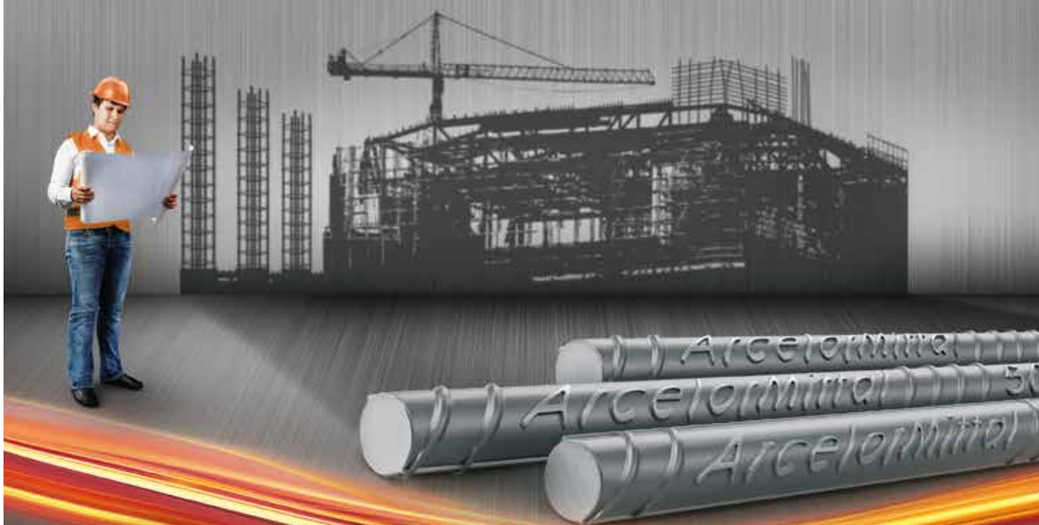
Armadura Pronta Soldada

A ArcelorMittal é a maior produtora de aço do Brasil e do mundo, com a mais completa linha para construção civil no país. Para se ter uma ideia, você encontra as soluções ArcelorMittal em grandes obras, como pontes e estradas, bem como na construção e reforma da sua casa. Levamos tão a sério nosso compromisso com a qualidade que gravamos ArcelorMittal em nosso aço. Então, grave esse nome. Quando pensar em aço, lembre-se: ArcelorMittal é aço.