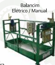
Balancim Elétrico / Manual