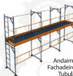
Andaime Fachadoiro/ Tubular